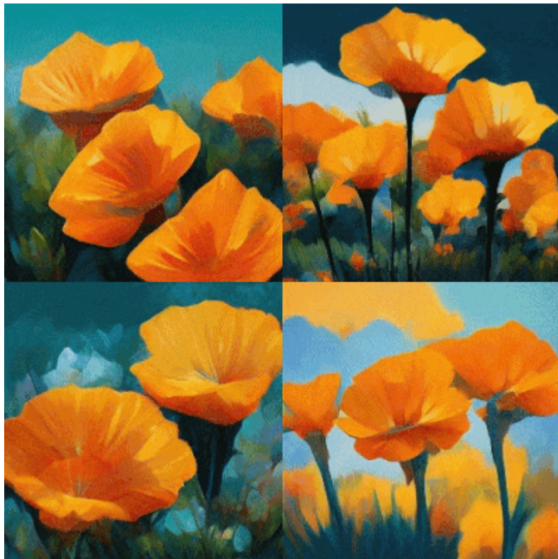
Vibrant California Poppies