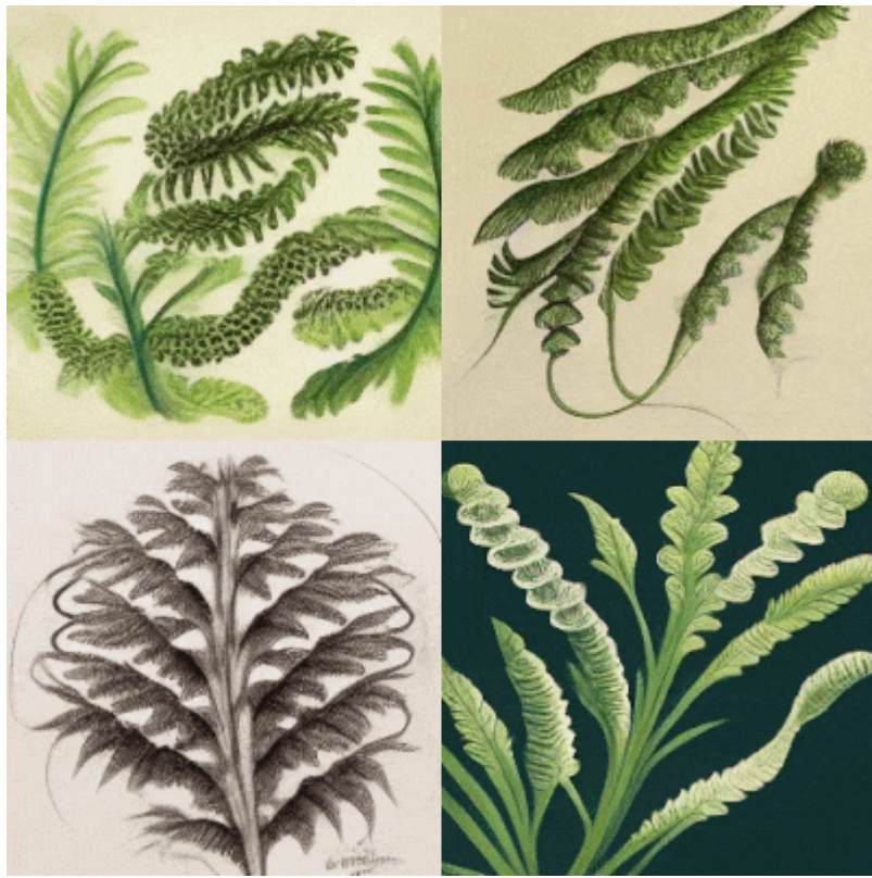
Botanical Sketch of Fanciful Ferns